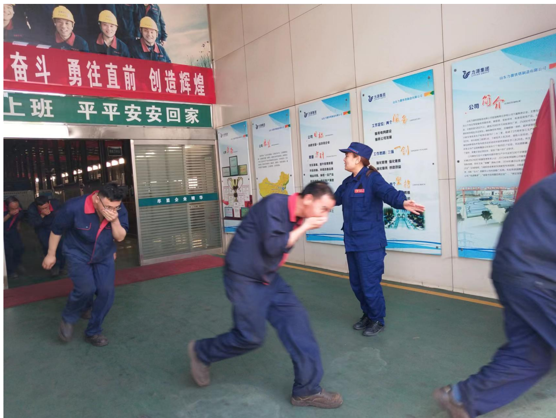
图 6.1 消防演练