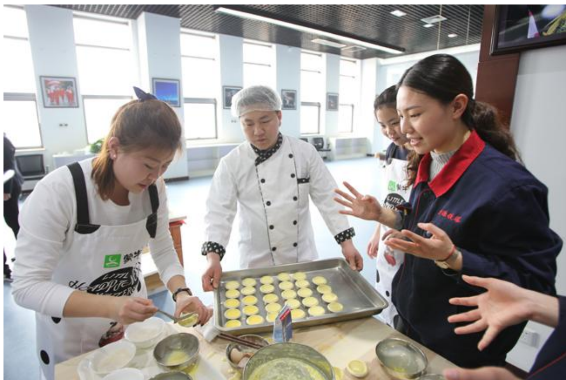
图 6.7 员工团建