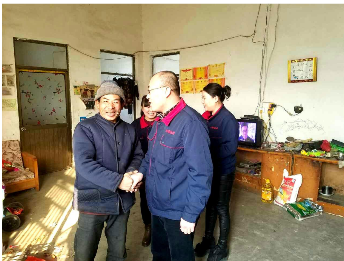
图 6.6 慰问职工