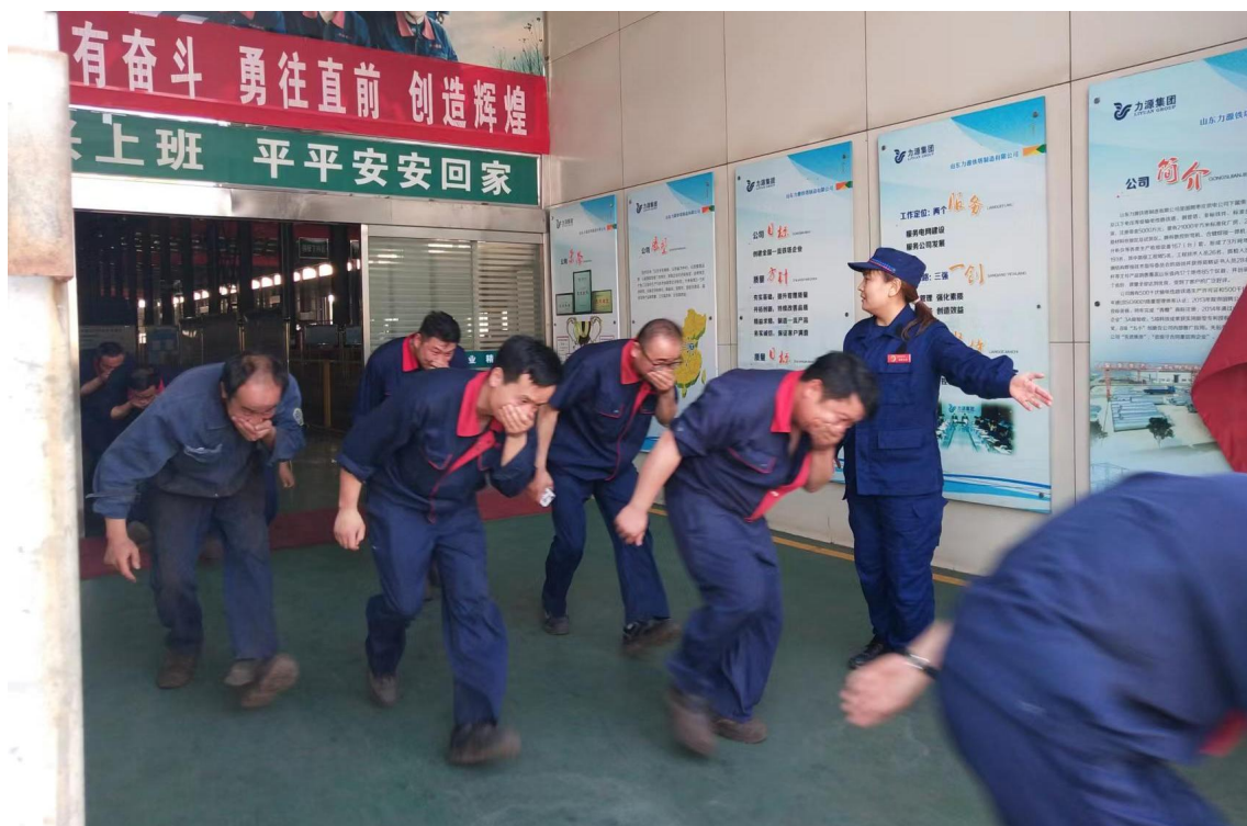
图 6.2 消防演练