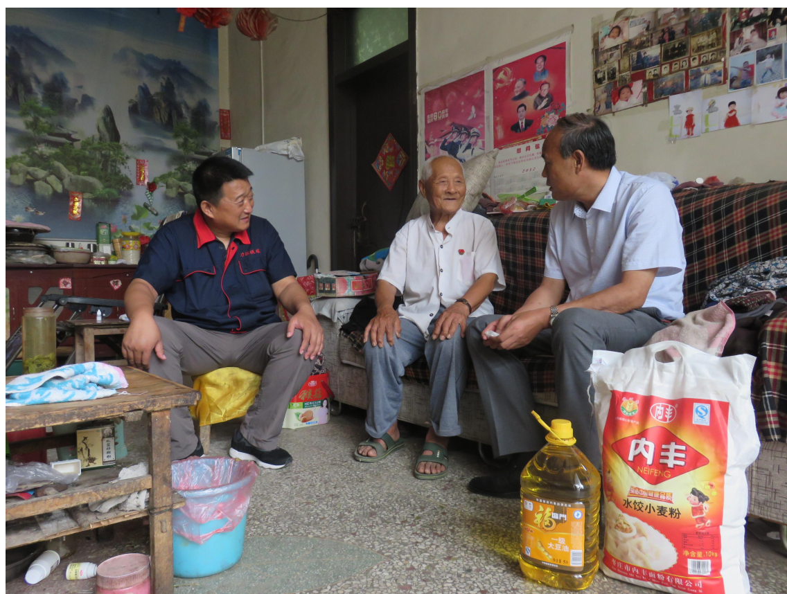
图 8.2 慰问老党员