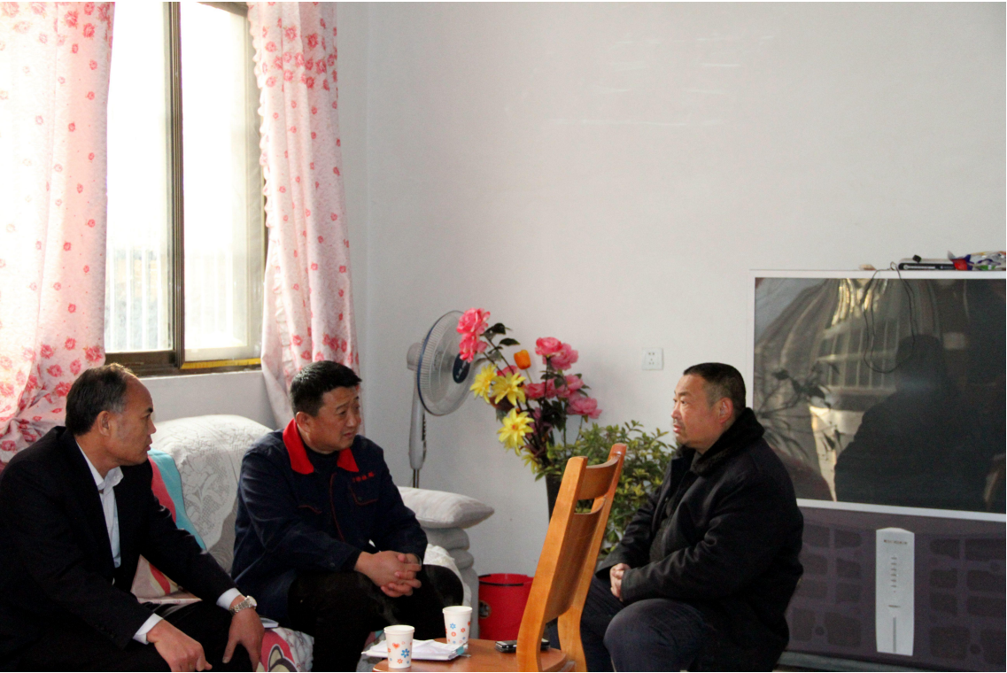
图 6.4 慰问职工