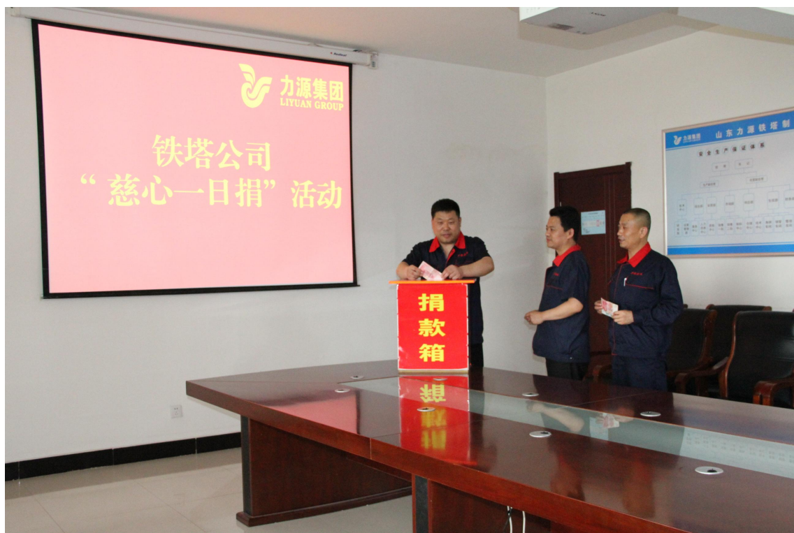
图 8.1 捐款活动