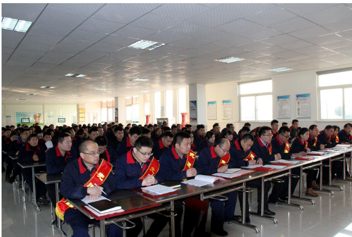
图 6.3 员工培训

提供公平的培训机会。通过培训不断提升员工的职业技能和综合素质，以推动企业的可持续发展。公司的培训内容体系搭建遵循“内容多样化、形式多样化、贴近业务、绩效挂钩”的原则，并通过制定《公司培训管理制度》、《培训管理规程》等制度以规范培训工作的落实。