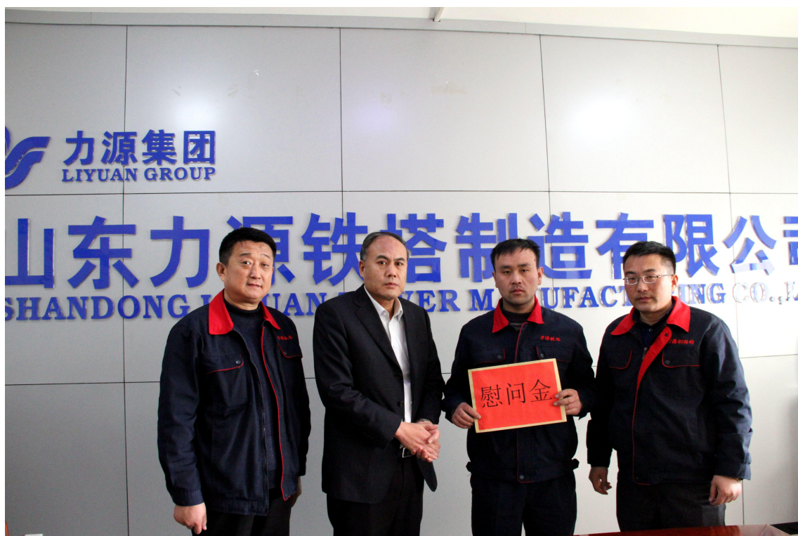
图 6.5 慰问职工