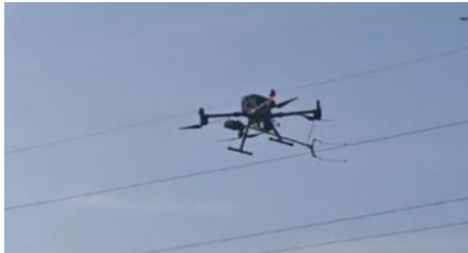
机载绝缘子检测装置升空