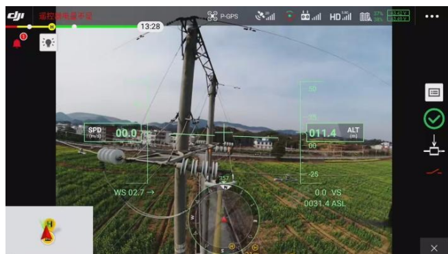
无人机拍摄画面（耐张串）