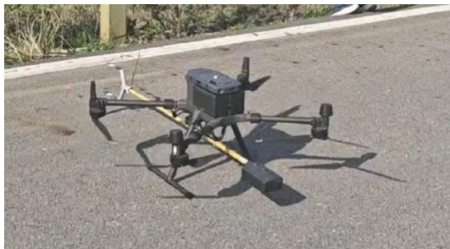
机载绝缘子检测装置