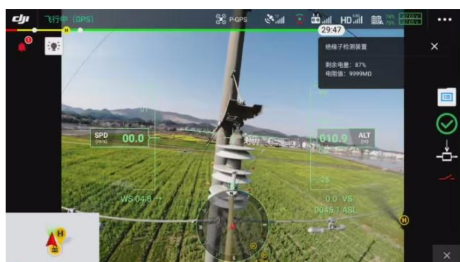
无人机拍摄画面（悬垂串）