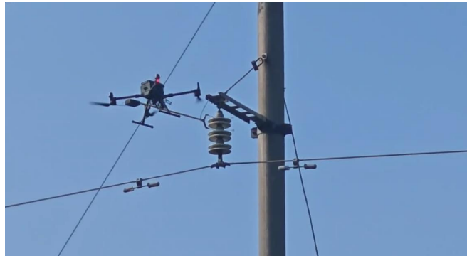
检测悬垂绝缘子串