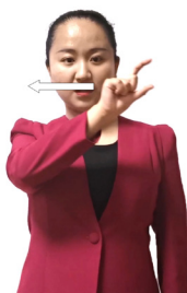
句子（行、横式、标题2、题目2）

一手拇指、食指张开，指尖朝前，向一侧移动一下；也用于表示一行、数学的横式、标题和题目。