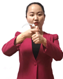
约束（束缚、限制、局限）

左手伸拇指；右手拇指、食指张开，指尖朝前，从后向下套向左手拇指，表示限定了范围。