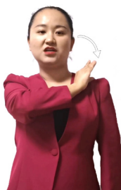
任务(责任、使命、委任)