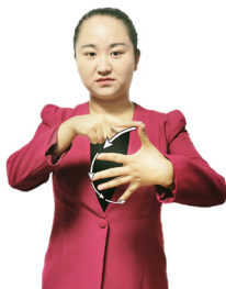
步骤（程序、顺序、依次）