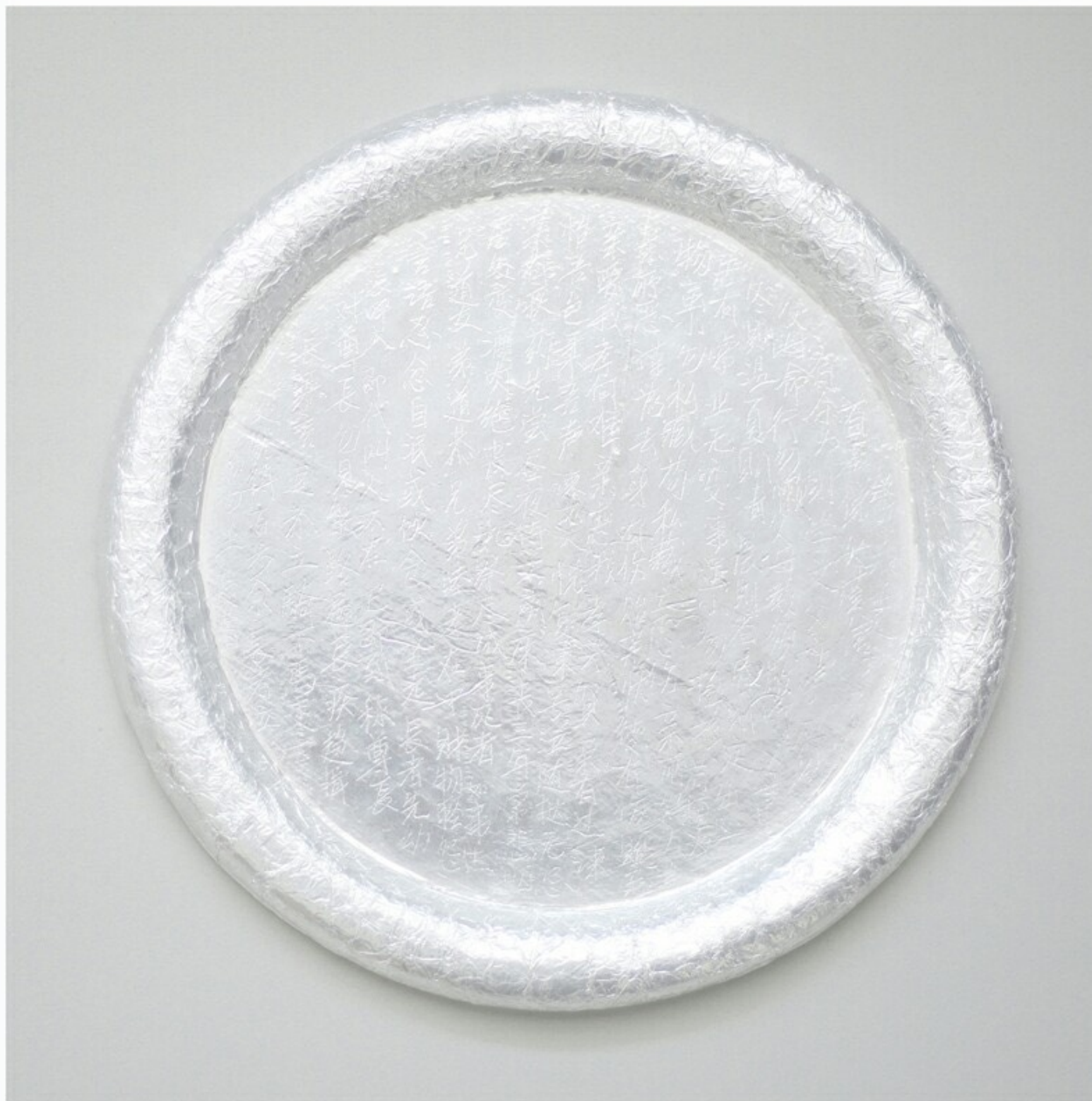
饕/弟子规，艺术微喷，50cmx50cm，2014