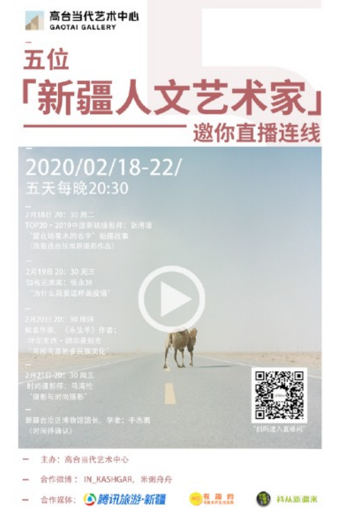
Online Event during the Quarantine Time for more than 3000 audiences