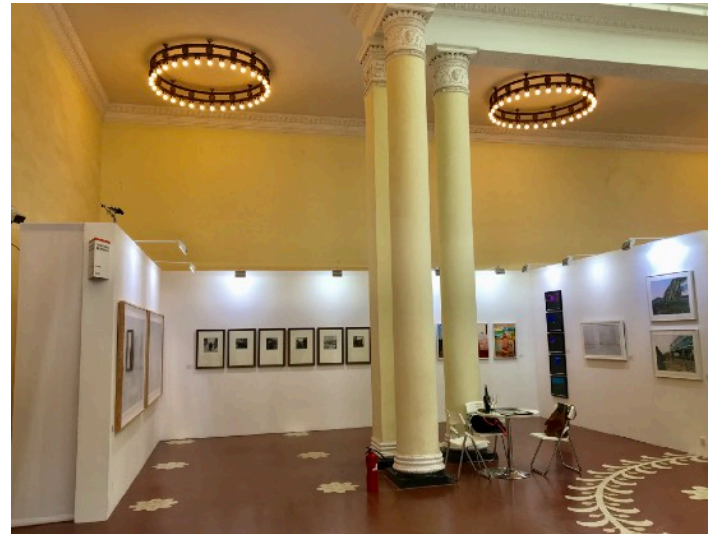
Participating Photofairs Shanghai 2019