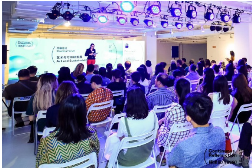
Co-hosting The Art and Sustainability Forum in Beijing with participated artists from 18 countries 联合主办了有来自18个国际地区艺术家参与的“艺术与可持续发展论坛”