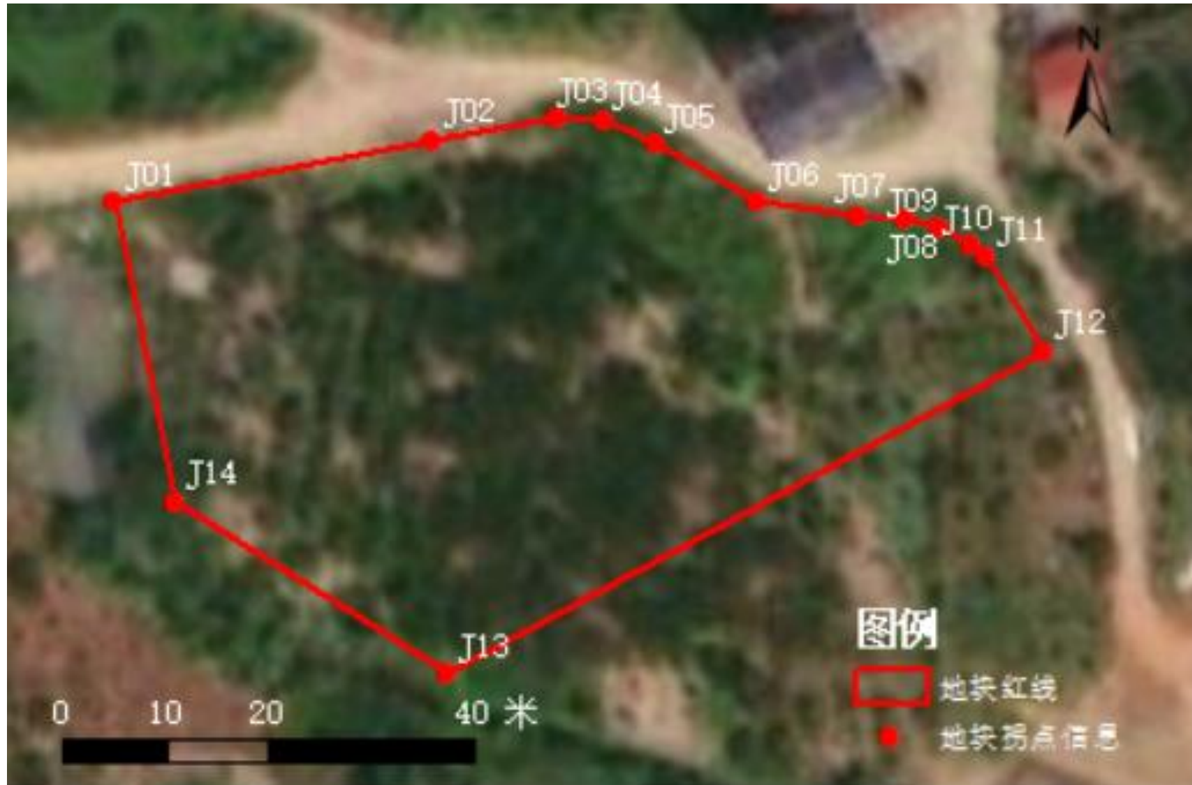
图 2.2-2 拐点图