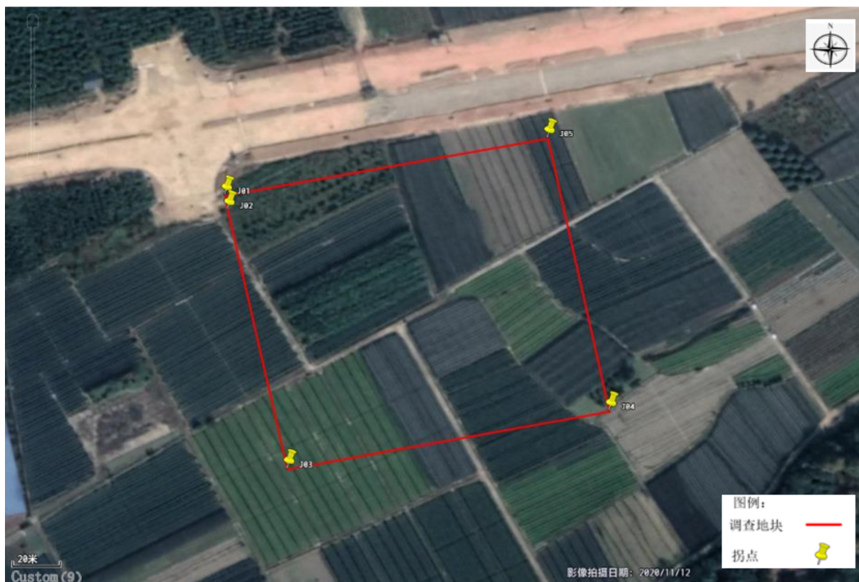
图 2.2-2 拐点图