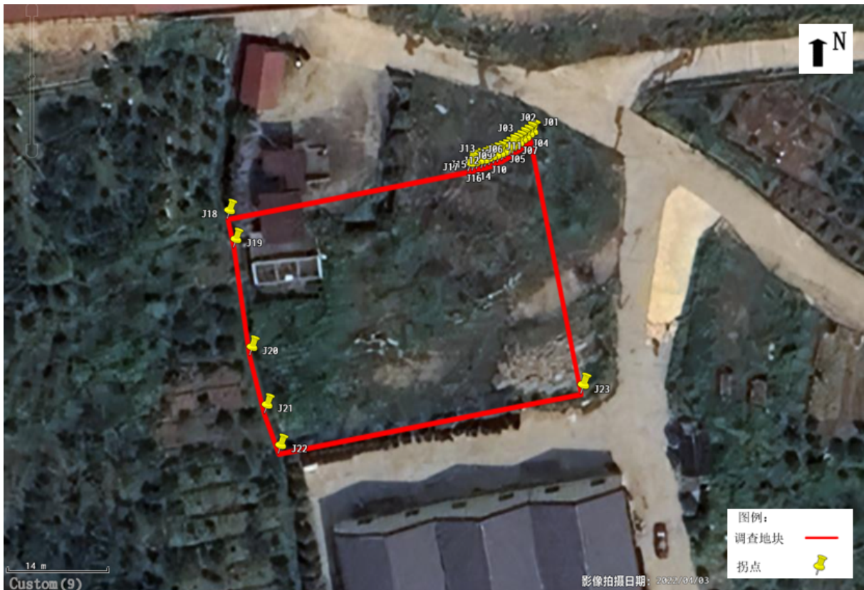
图 2.2-2 拐点图