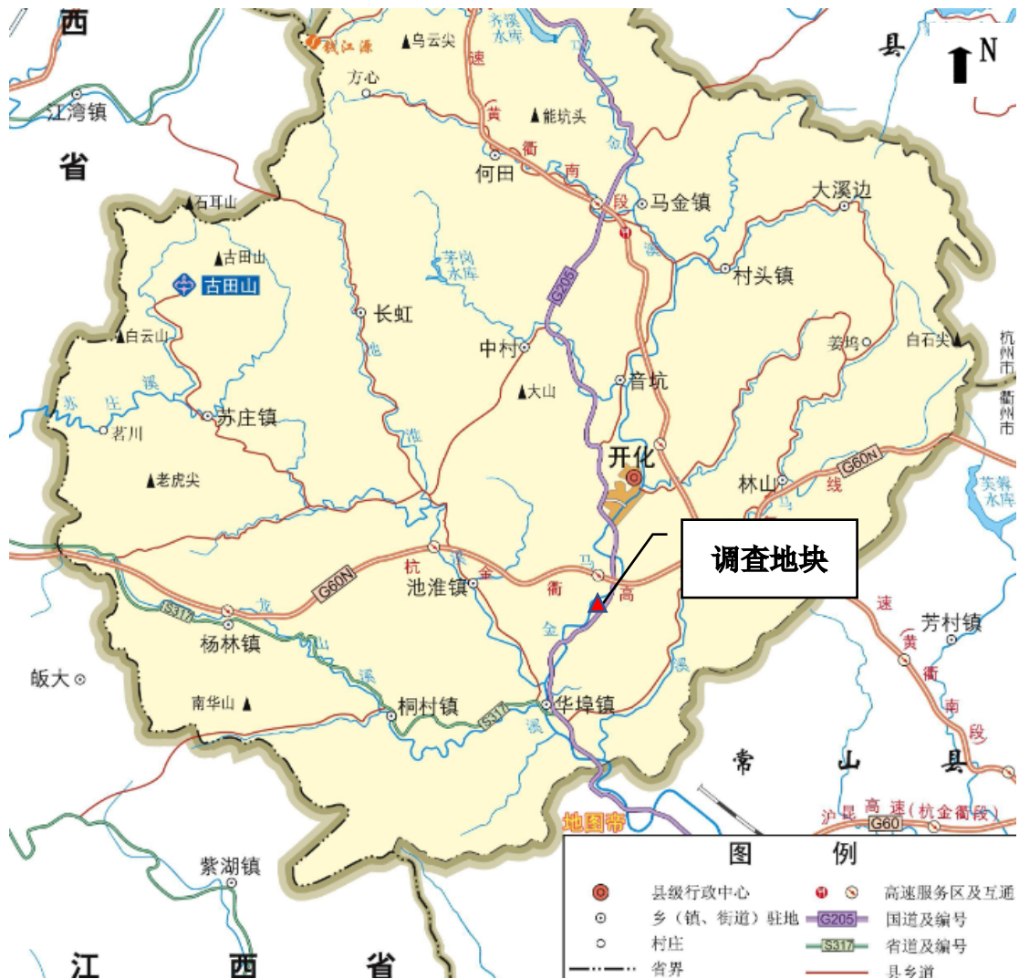
图 3.1-1 调查地块地理位置图

开化县华埠镇下溪村 2024-1 号地块位于浙江省衢州市开化县华埠镇下溪村、朝阳村，地块中心坐标为：118.383822° E；29.069899° N。地块外东侧为农用地，南侧为农用地，西侧为农用地，北侧为道路城白线。具体位置详见图 3.1-1 及图 3.1-2：