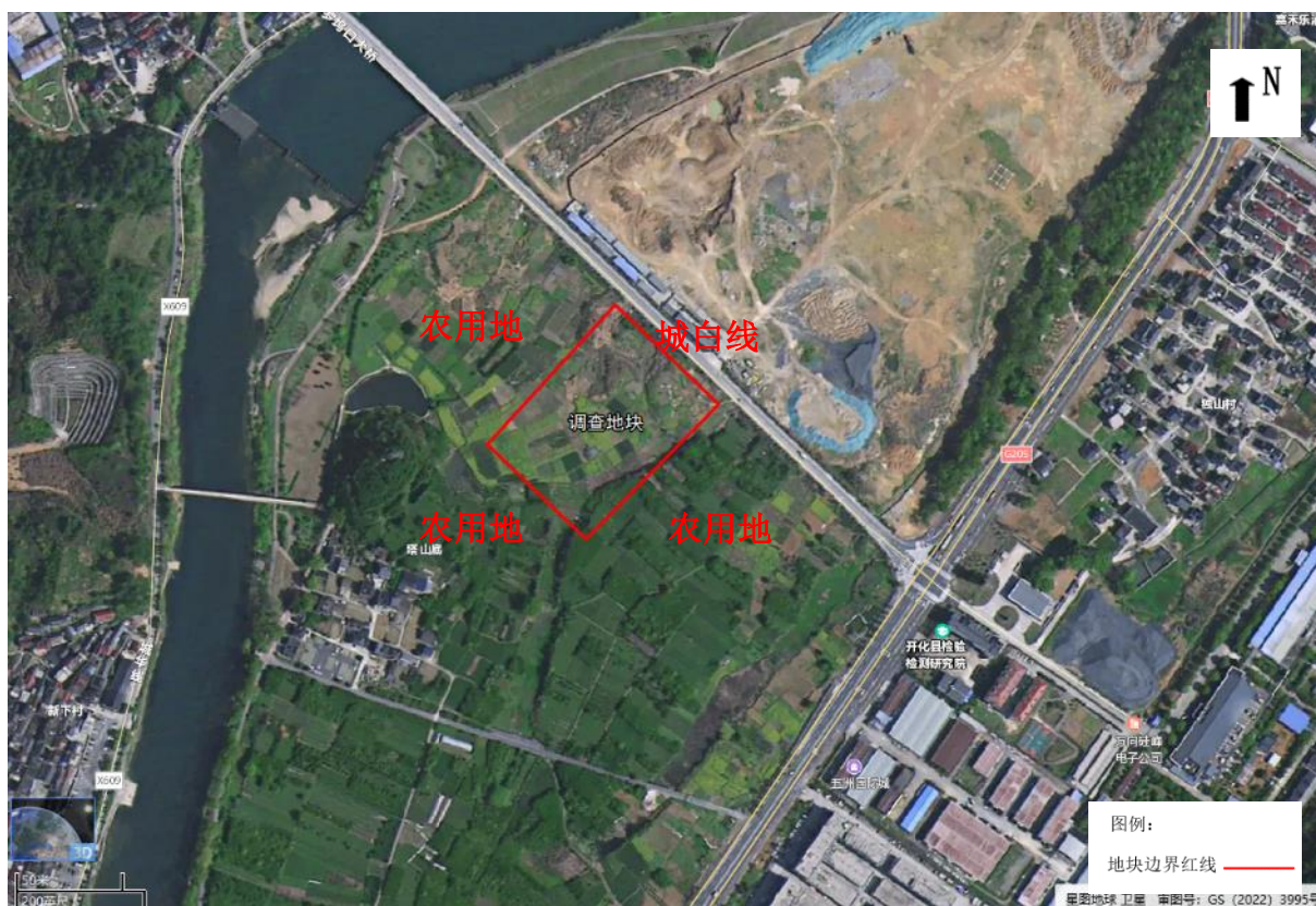
图 3.1-2 调查地块卫星影像图