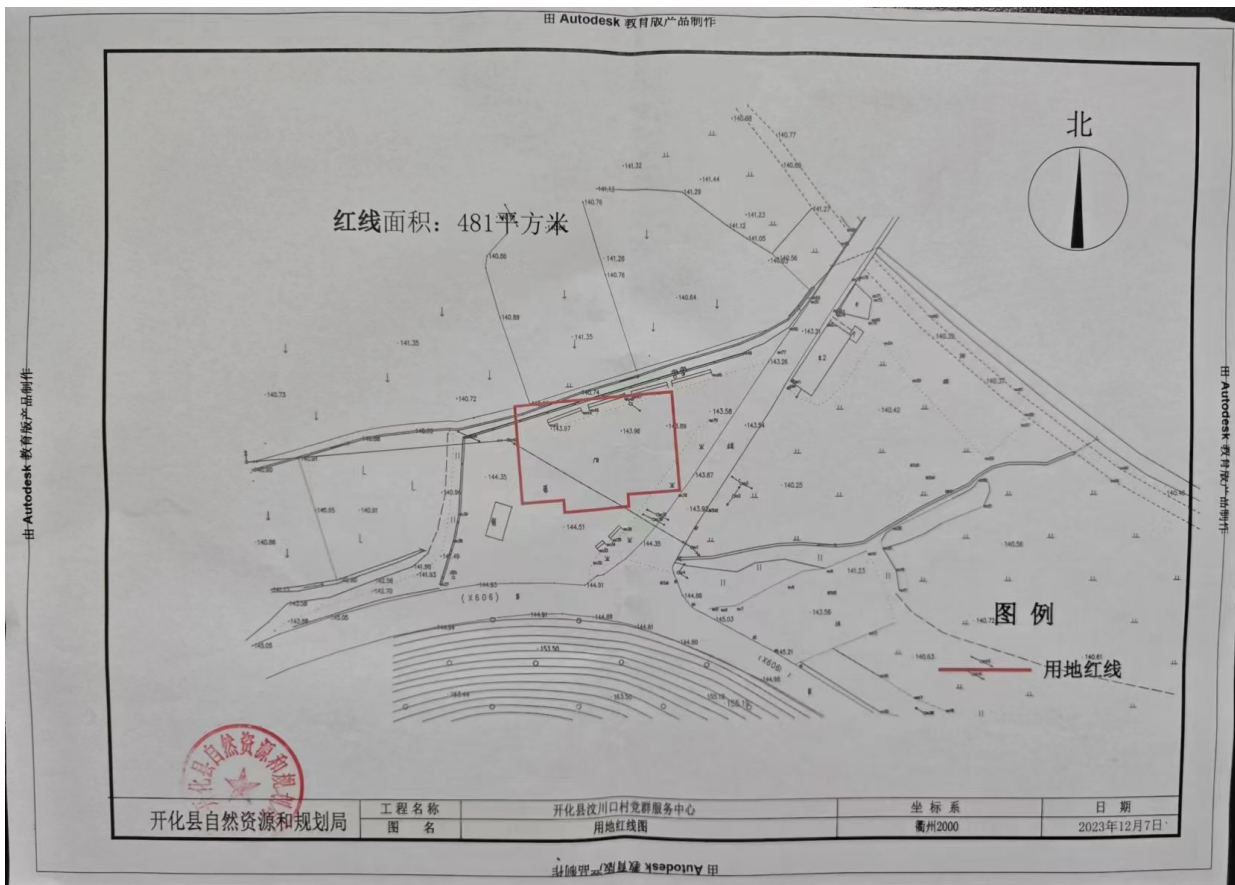
图 2.2-1 调查地块红线图