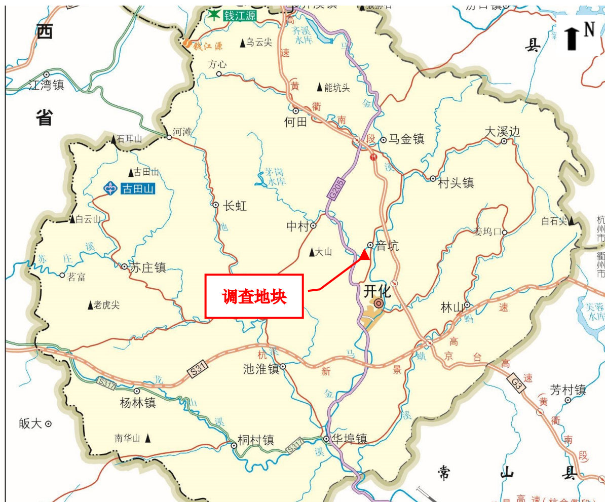
图 3.1-1 调查地块地理位置图

调查地块位于开化县音坑乡汶川口村 2023-01 号地块位于衢州市开化县音坑乡汶川口村，地块中心坐标为：118.378313° E；29.189880° N。地块东侧毗邻村道，南侧毗邻道路陈张线，西侧毗邻农用地，北侧毗邻农用地。具体位置详见图 3.1-1 及图 3.1-2：