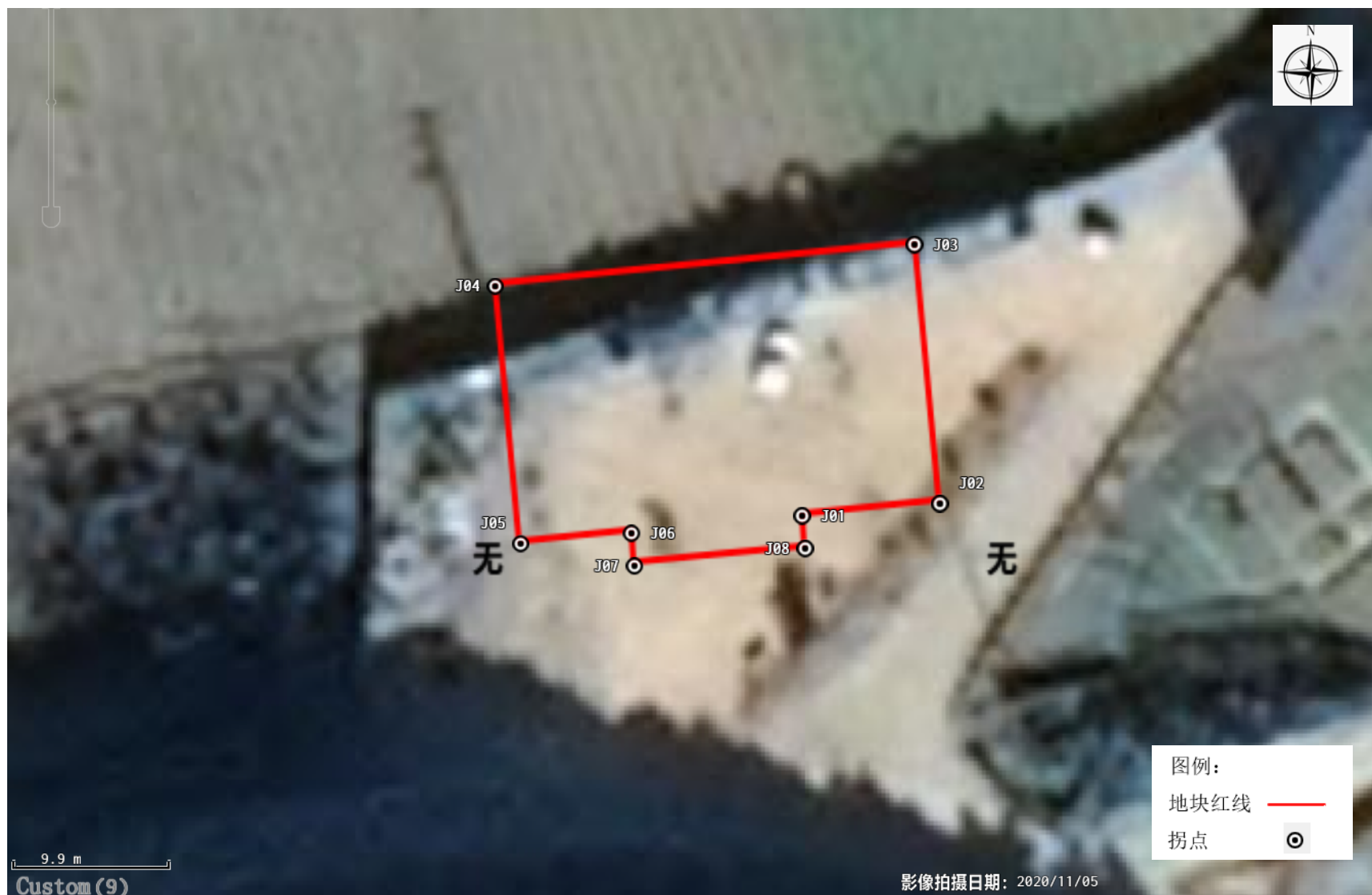
图 2.2-2 调查地块拐点图